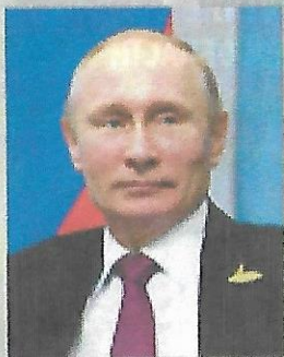
Президент РФ В. В. Путин

«Сегодня сфера ответственности пограничных органов значительно расширилась. Наша граница должна быть серьезным препятствием для международных террористов, транснациональной преступности, наркобаронцев, нелегальных мигрантов. Особого внимания требует защита экономических интересов и культурного достояния России. Уверен, что нынешнее поколение пограничников приумножит лучшие традиции своих предшественников, будет достойно решать поставленные задачи»