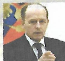
Директор ФСБ России генерал армии А. В. Бортников

«Сегодня и сотрудникам пограничных органов предъявляются повышенные требования, перед ними стоят сложные, многоплановые задачи по внедрению новых форм и методов в оперативно-служебной деятельности, повышению уровня технической оснащенности. Убежден, что сотрудники пограничных органов и впредь с честью будут выполнять поставленные задачи, проявлять высокие профессиональные и нравственные качества, обеспечивать надежную охрану рубежей Родины»